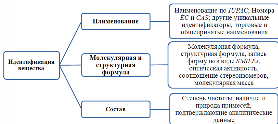
Рис. 1. Идентификационные параметры химических веществ.

Основной признак идентификации химической продукции - это ее наименование (техническое, торговое, наименование по общепринятой номенклатуре международного союза по теоретической и прикладной химии (IUPAC) или ее кодовое обозначение (номер CAS или EC). Исходя из известного наименования или обозначения при помощи референтных источников, можно узнать всю остальную требующуюся информацию. Эффективность данного признака идентификации целиком зависит от наличия и качества упомянутых референтных источников. В случае, когда в наличии нет достоверного источника, идентификацию химической продукции можно провести при помощи указания химического состава и структуры.