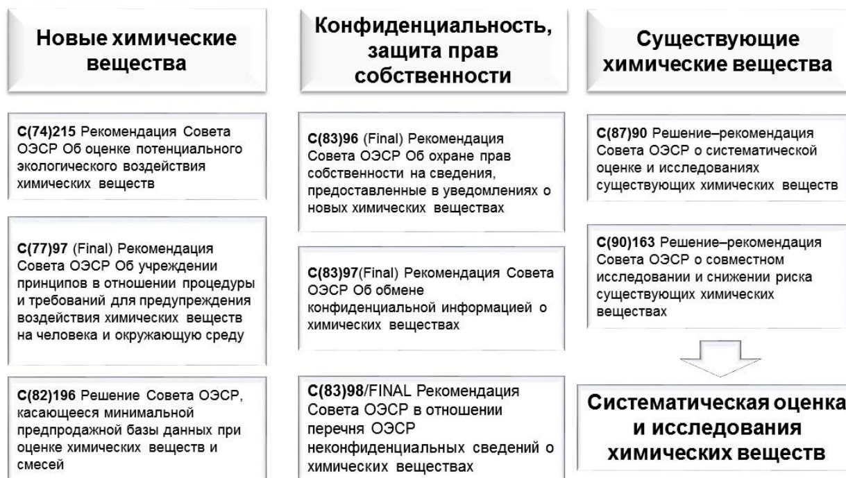
Рис. 2. Некоторые акты Совета ОЭСР по вопросам регулирования обращения химических веществ.

Обычно к производителям или импортерам химических веществ, не указанных в национальном перечне страны, предъявляются требования по предоставлению в уполномоченные органы исчерпывающей информации об опасности химического вещества и его потенциальном воздействии на человека и окружающую среду. Объем запрашиваемой информации о новом химическом веществе, как правило, соответствует Минимальному предпродажному набору данных (ОЭСР), установленному Решением Совета ОЭСР С(82)196. Данный набор ОЭСР включает в себя следующие основные типы данных: идентификационные данные химического вещества (например, наименование по ИЮПАК, номер CAS), данные по производству, использованию, утилизации химического вещества, аналитические методы контроля, меры предосторожности и реагирования в чрезвычайных ситуациях, физико-химические данные, данные по острой токсичности, хронической токсичности при многократном/продолжительном воздействии (14-28-дневные тесты), данные по мутагенности, некоторые сведения по экотоксичности, а также разложению/накоплению химического вещества в окружающей среде.